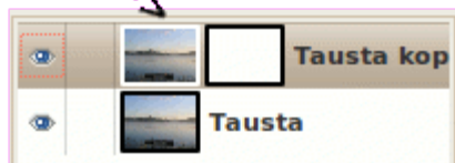
Kuva 2: Aktiivisen tason erottaa valkoisista reunoista. Valkeassa tasossa reunus ei kylläkään erotu.

Työskenneltäessä tasojen ja tasomaskien kanssa kannattaa olla tarkkana, mikä taso tai tasomaski on aktiivisena. Muutokset kohdistuvat vain siihen ja väärä valinta tuottaa virheellisen lopputuloksen. Aktiivinen taso tai tasomaski näkyy tasotyökalussa valkoreunaisena. Tasomaskista valkeita reunoja on kylläkin vaikea erottaa valkoisen pohjaväriin takia, mutta tasomaskin reunat ovat mustat silloin kun se ei ole valittuna.